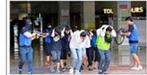
LOS EJERCICIOS, en Goyang (Corea del Sur), incluyen simulacros de tomas de rehenes y operativos antiterroristas.