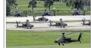
EN LAS MANTOBRAS, que duran 11 días, participan 17.500 soldados estadounidenses y 50.000 surcoreanos, más equipos bélicos.